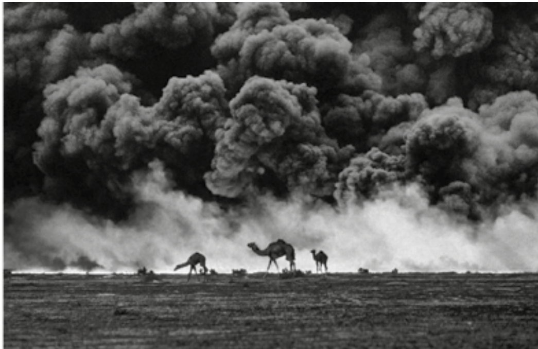
Tomado de McCurry, S. (1991). Camellos y campos de petróleo. Kuwait.

Para continuar con el análisis de la guerra del Golfo Pérsico, el equipo de estudiantes va a interpretar críticamente diversas fuentes para comprender los sucesos que ocurrieron durante la guerra. Una de las fuentes analizadas es una fotografía tomada por Steve McCurry, que muestra la quema de pozos de petróleo en Kuwait en marzo de 1991. A continuación, se presenta dicha fotografía: