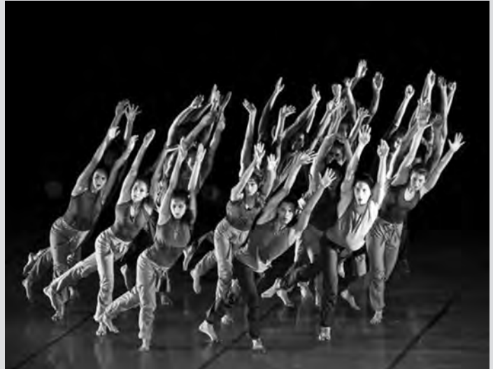
Extraído de “Danza Contemporánea de Cuba” (2014). Agenda Lugano .

El docente propone a los estudiantes realizar la dinámica del “cardumen”. Todos los estudiantes deben pararse muy juntos en el centro del aula. Uno de los estudiantes será el líder y propondrá diversos movimientos y desplazamientos, que deberán ser copiados por todo el grupo al unísono, como si fueran un banco de peces o una bandada de aves que se mueve coordinadamente. El rol de líder será rotativo entre los estudiantes y todos los demás deberán imitarlo, realizando sus movimientos al mismo tiempo y sin hablar entre ellos.