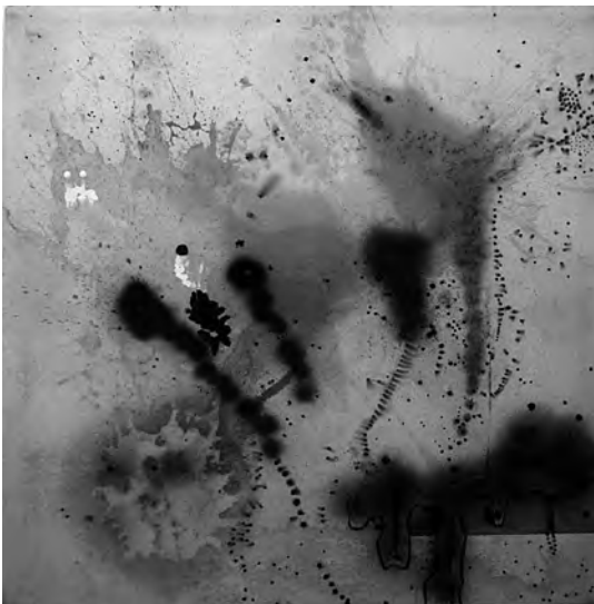
Rodríguez Larrain, E. (2006). Sin título .