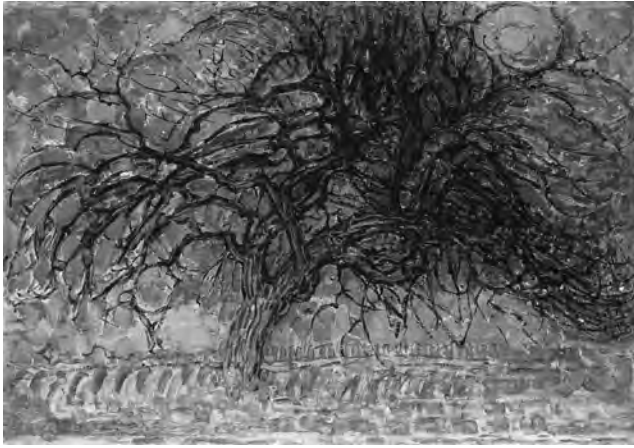
El árbol rojo (1908).