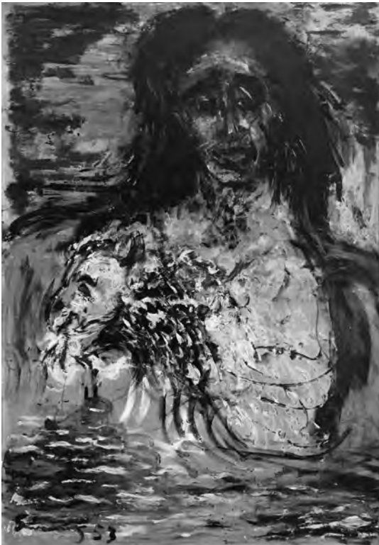
Gutiérrez, S. (1953). Bruja de Cachiche .