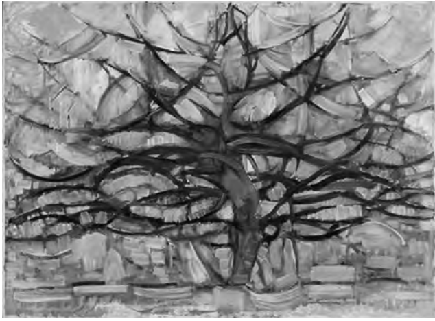
El árbol gris (1911).