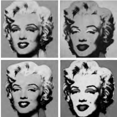
Warhol, A. (1967). Serie Marilyn Monroe .