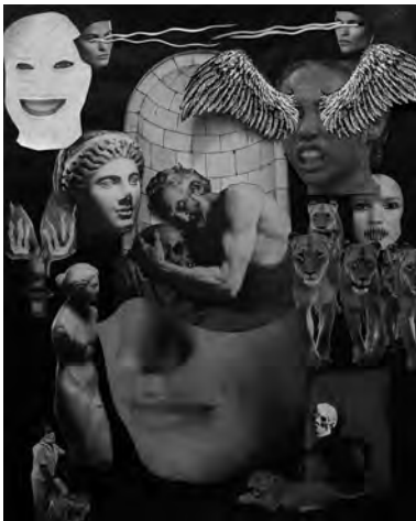
Swofford, J. (2017). San Jerónimo abraza su propia mortalidad .