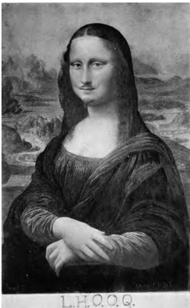
Duchamp, M. (1919). L.H.O.O.Q.