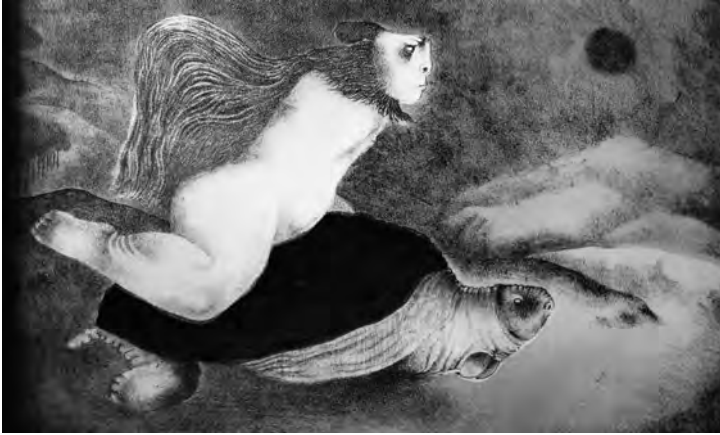
Tsuchiya, T. (1974). El mito de los sueños .