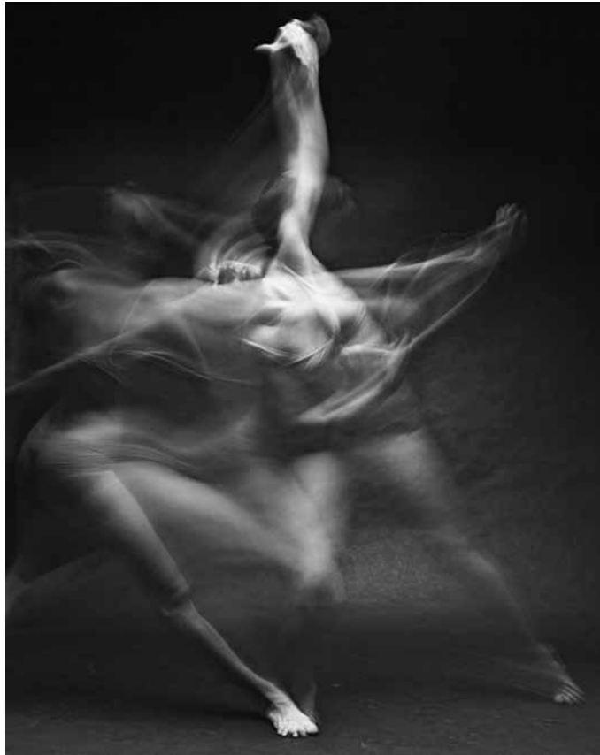
Fotografía de la serie Motion de Bill Wadman. Recuperada de https://tinyurl.com/yc9x6um8

¿Cuál es el recurso visual que más destaca en la siguiente fotografía de Bill Wadman (Estados Unidos, 1975)?